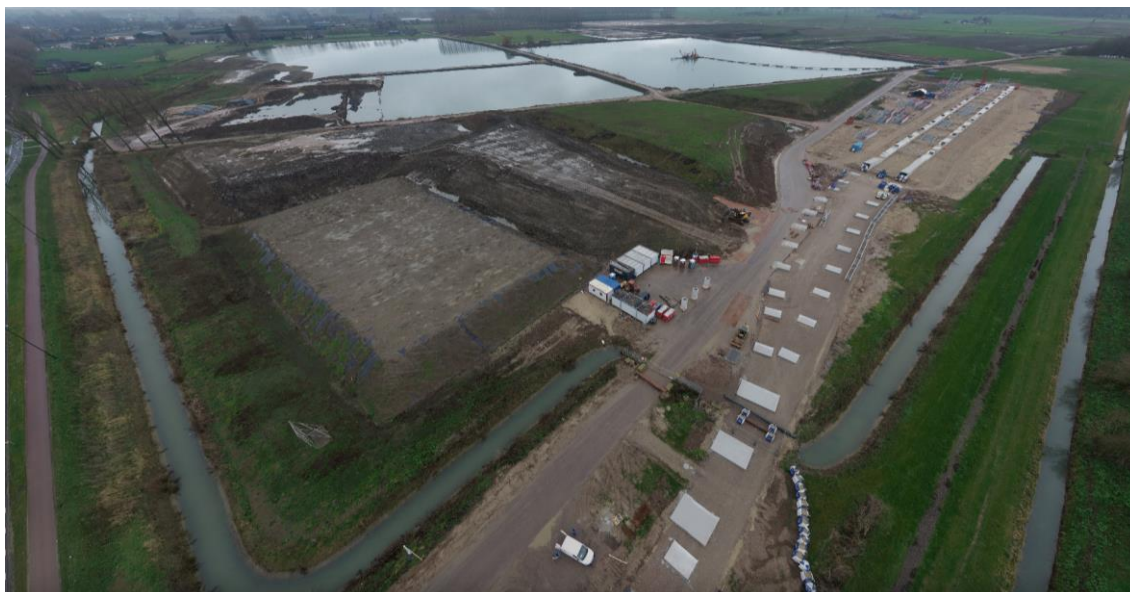
Luchtfoto december 2020

Binnen de taludzone zal een werkwijze worden gevolgd waarbij de profielzuigers evenwijdig winnen aan het talud en daarbij laagsgewijs van boven naar beneden werken. Buiten de taludzone gelden geen specifieke beperkingen.